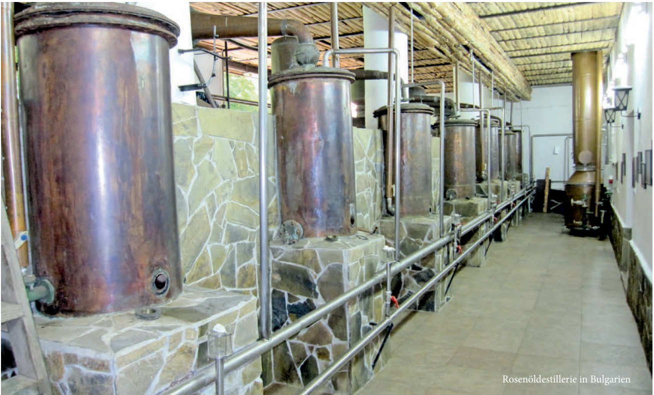
Rosenöldestillerie in Bulgarien